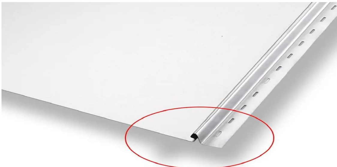
Stehfalz CLIC AluZink - Stärke 0.5 + 0.7mm

Beratung mit preisoptimierten Angeboten VOR Kauf unter